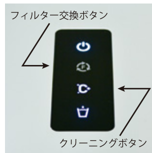
フィルター交換ボタン

フィルタ交換の時期やクリーニング時期もしっかり通知！クリーニングはボタンを押すだけの簡単作業！